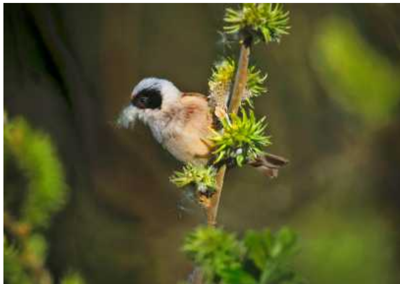
Pungmes med bomaterial.