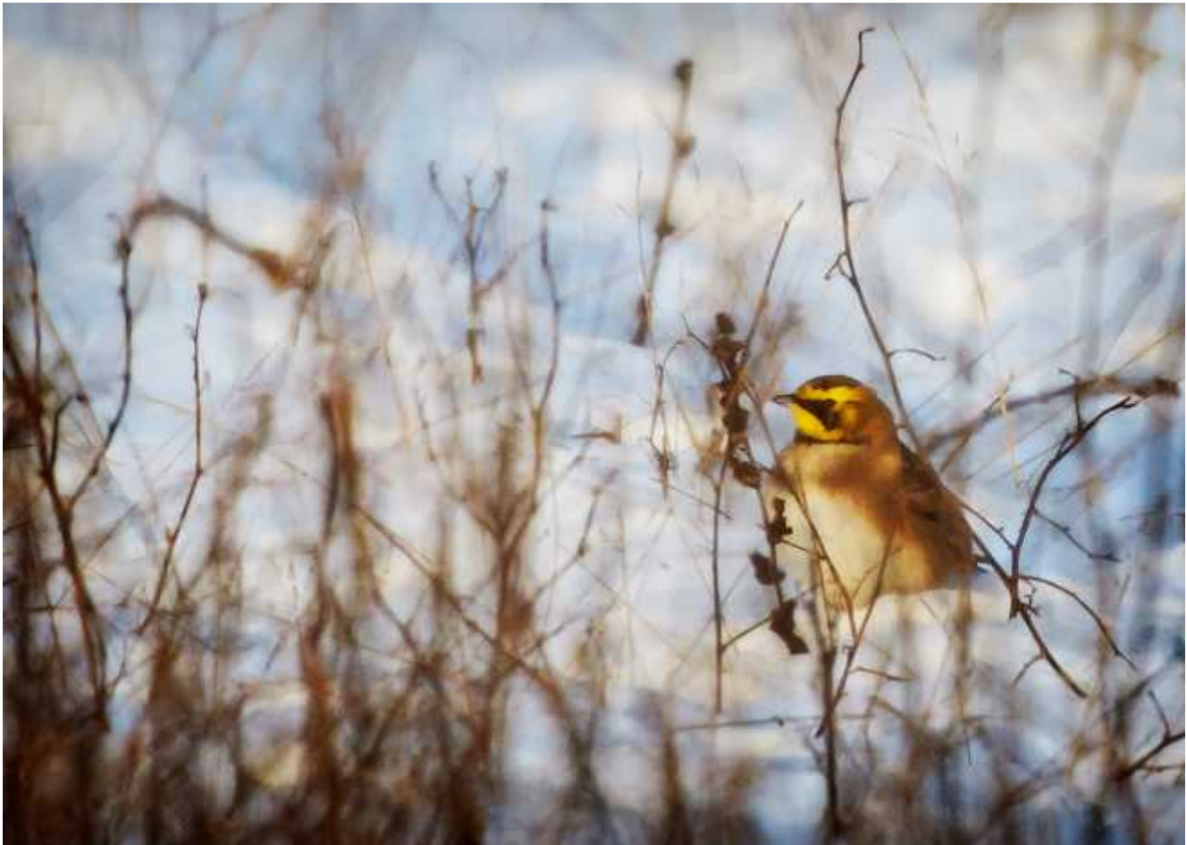
Berglärka, Eremophila alpestris. En trevlig färglick i vinterlandskapet.

Den 19e januari var det dags för årets första exkursion med klubben. Olle Strandroth hade hittat en berglärka vid gamla motorbanan öster om värmeverket så vi hade förhoppningar om att den skulle vara kvar så vi kunde få se den och få kryssa arten i kommunen. Berglärkan var kvar och alla fick se den!