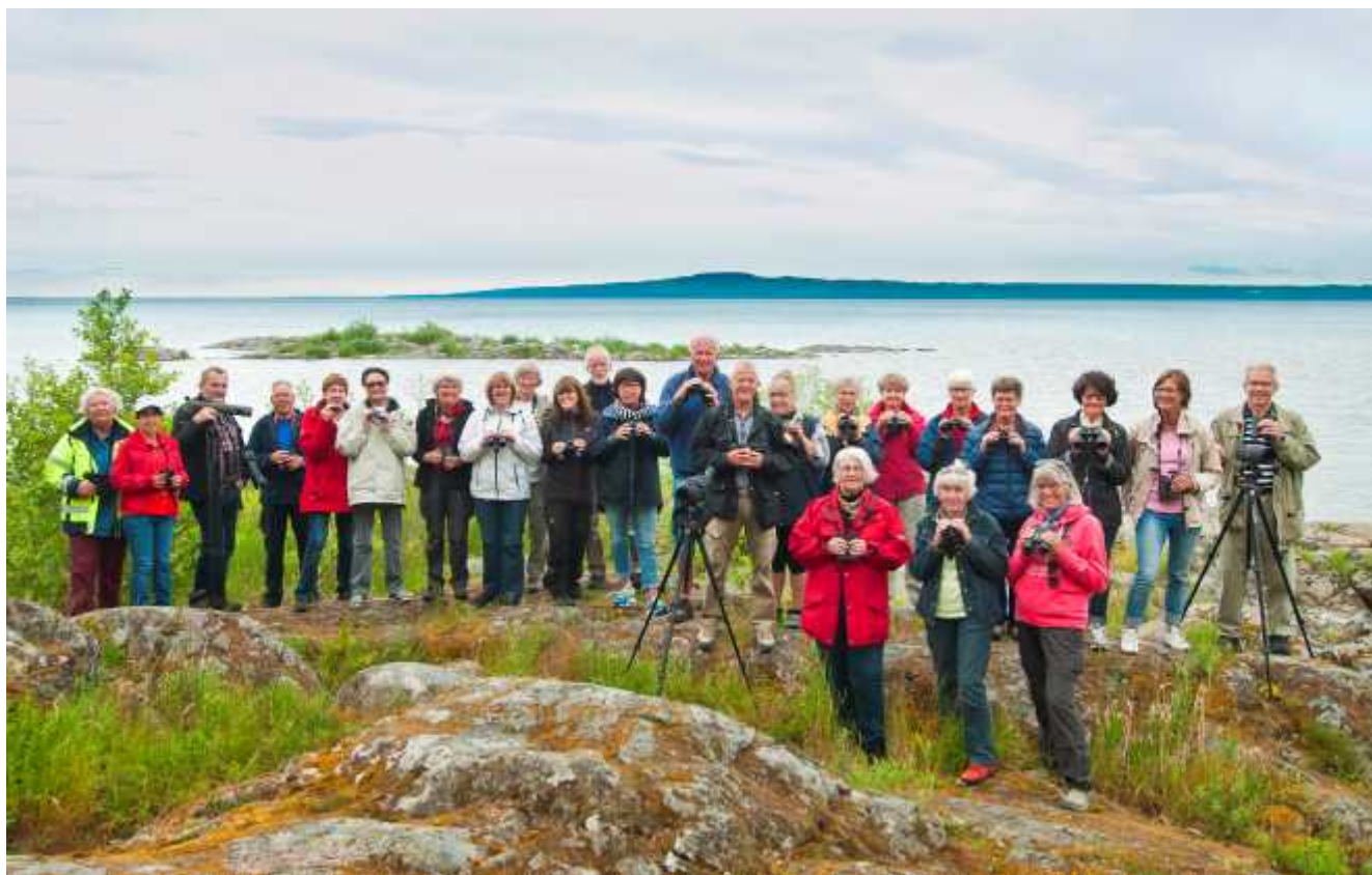
En stor del av kursdeltagarna samlade i Mövik med 100-talet fisktärnor på skäret i bakgrunden.