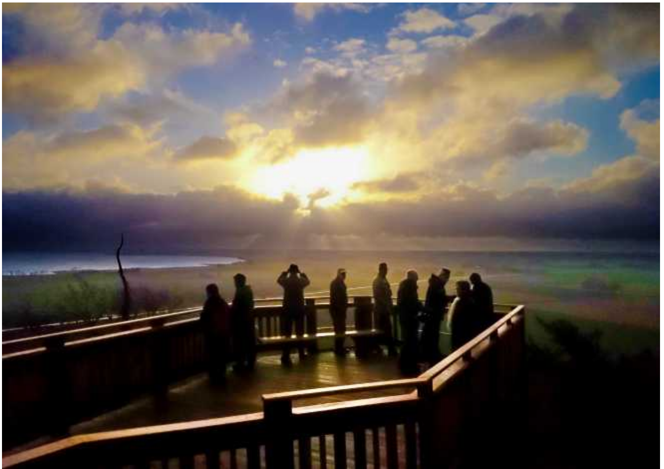
Stämningsfull bild över Dättern och Flobygden från nya plattformen vid Flo klev.

Söndagen den 13 april var det dags för årets tredje exkursion som gick till platåbergen Hunne- och Halleberg. Den tretåiga hackspetten var väl den fågel som de flesta hoppades att få se men då "Kajsa Blås" tog i för allt hon var värd fick den tappra skaran skådare nöja sig med "de vanliga". Det vill säga skogens små stannfåglar samt de få som hunnit återvända från vinterkvarteren.