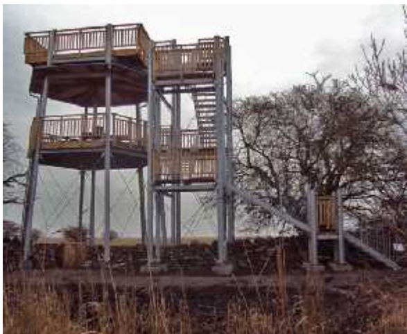
Tornet i Södra Lunden.

Anmälan är bindande! Anmälningsavgift på 200:- kr/pers. skall finnas på klubbens pg. 72 78 59 – 1 senast tre arbetsdagar efter sista anmälningsdatum.