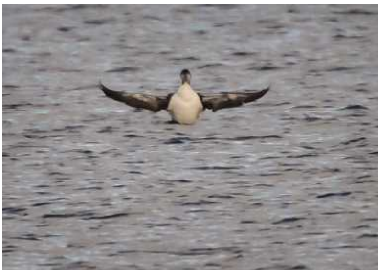
Svartnäbbad islom, Gavia immer .

Årets publika val föll på svartnäbbad islom som är en gäst från kallare breddgrader. Det var första gången den blev sedd i Kinnevikens och rapporterad från vårt område. Även denna fågel var lite nyckfull. Ena dagen visade den sig nära land och lät sig villigt fotograferas. Nästa dag låg den långt ut i stora farleden där den kunde vara mycket svår att observera utan tubkikarens hjälp. Den sågs här mellan 04 – 19 november.