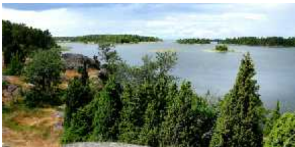
Vy från Spårö huvud.