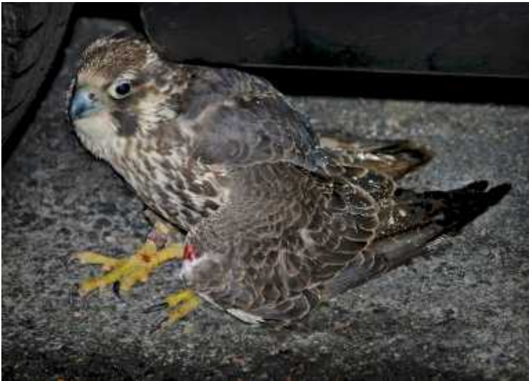
Pilgrimsfalken som drabbades av olycka.