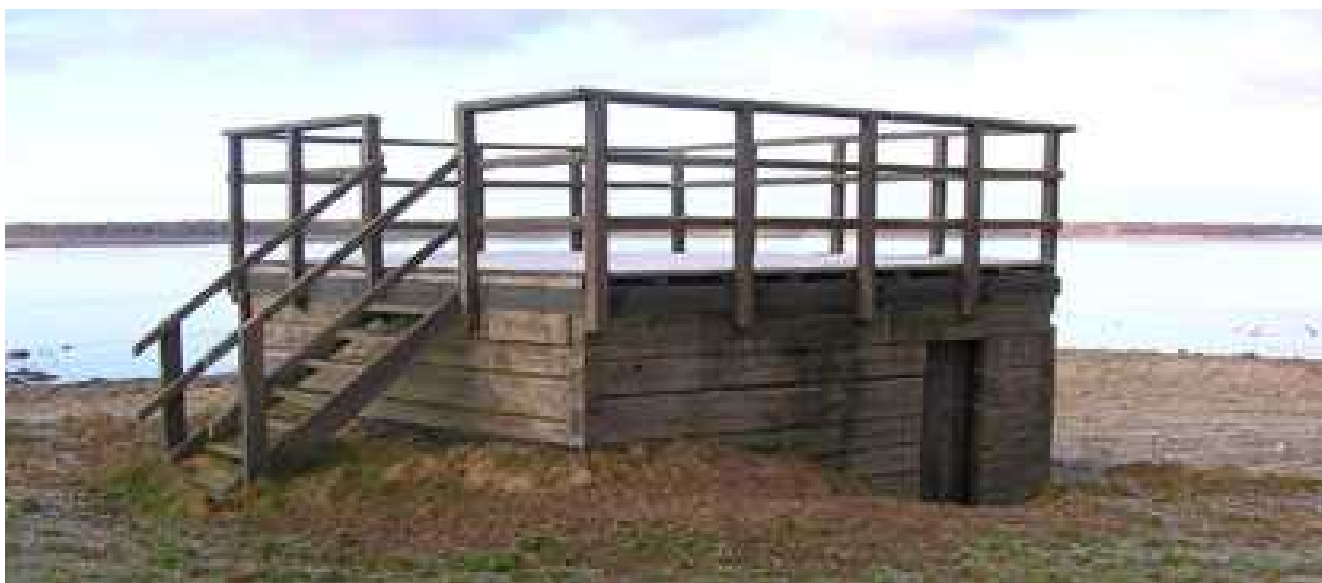
Plattformen vid Ytterberg.

Årets majmöte blev ett möte med förhinder – eller kanske man skall säga stoppades av vädergudarna. Kvällen den 6 mars 2014 bjöd inte på något lämpligt väder för fågel-skådare. Regnet formligen öste ner så de få tappra som mötte upp beslutade att det skulle skjutas upp en vecka. Kommande tisdag var vädret mer lämpligt för skådning och de som mötte upp begav sig till Ytterberg, en av Hornborgasjöns fina lokaler. En udde som sträcker sig en bit ut i sjön. Resultatet blev dock en aning klen och kan sammanfattas på det sätt som en av deltagarna uttryckte det "Dä' ble' bara dä' vanli'a".