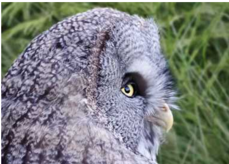
Lappuggla, Strix nebulosa .