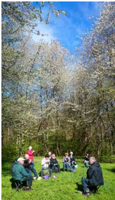
Fikapaus vid Brännebacken, Källby.