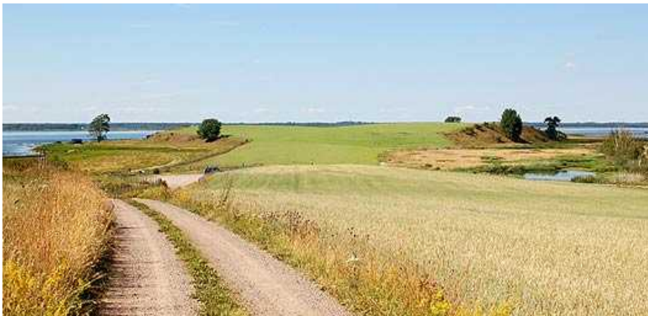
Ytterberg, en av många "säkra" obs-platser runt Hornborgasjön.