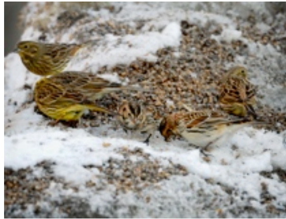
Lappsparvar i hamnen i början av 2012