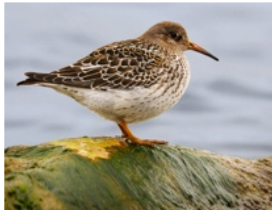
Skärnsnäppa i hamnen

Vinterfynd: 1 ex Blomberg 12.1 (Ulf Wiktander).