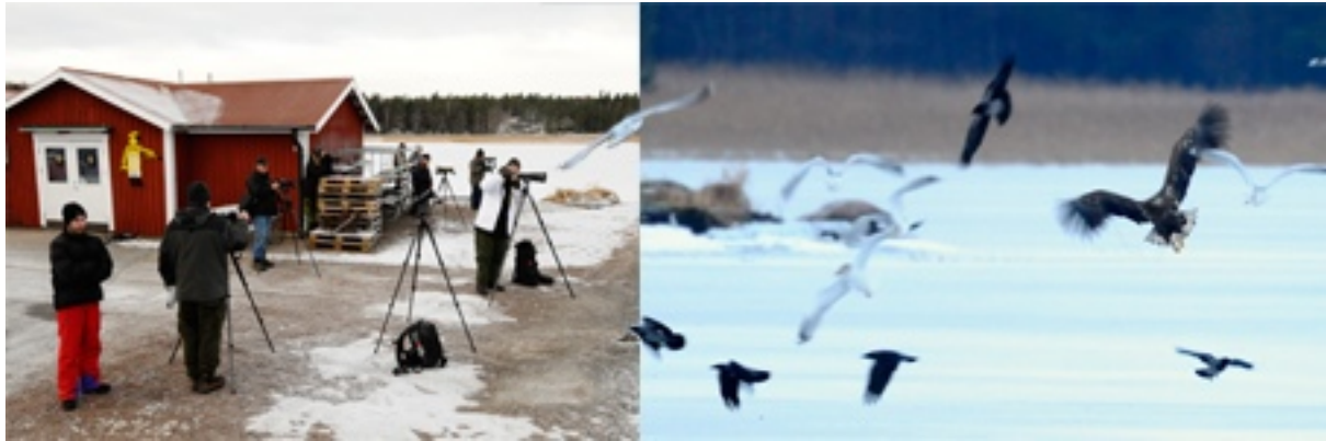
Jonny Berggren med bilder av Olle Strandroth

Här kommer det en liten text av Jonny om denna exkursion. Bildkollaget nedan är ett förslag.