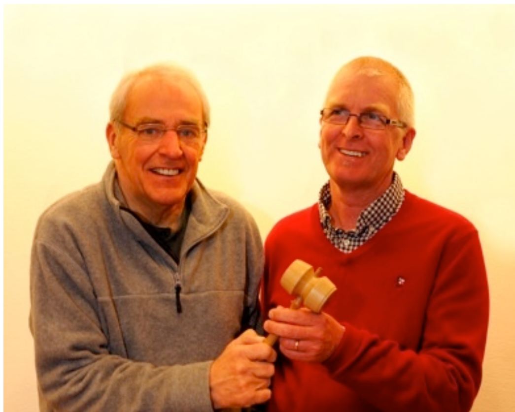
Två gamla uvar