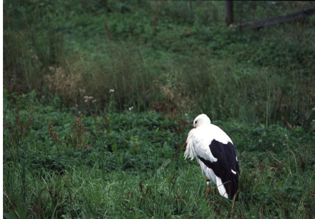
Vit Stork ej observerad 2003 Hessle