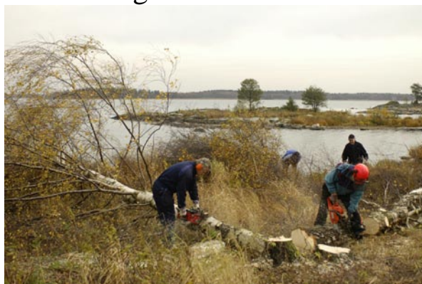
Röjning av fågelskär