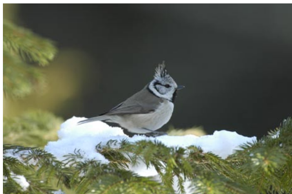
Fågelskådning av tofsmes