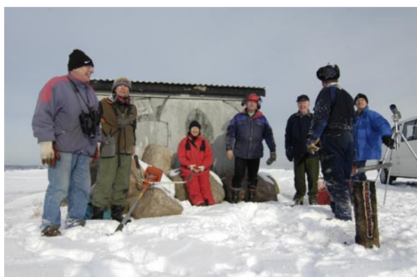
Utfärd med klubben i alla väder