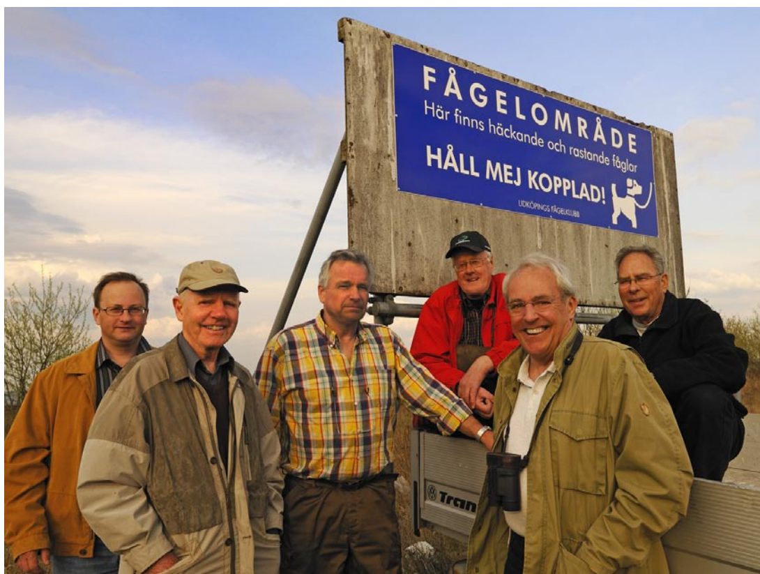
Ett koppel fågelskådare vid östra hamnen

Informationsblad för medlemmarna i Lidköpings Fågelklubb Nummer 1 år 2009 Årgång 33