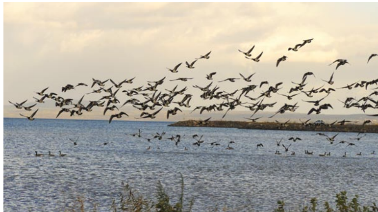
Vitkindad gås vid Framnäs

Den största ansamlingen av vitkindade i vår kommun höll till i Framnäsviden under senhösten.