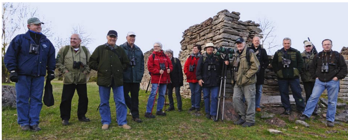
Klubbekursion till Kinnekulle en vårväll 2009