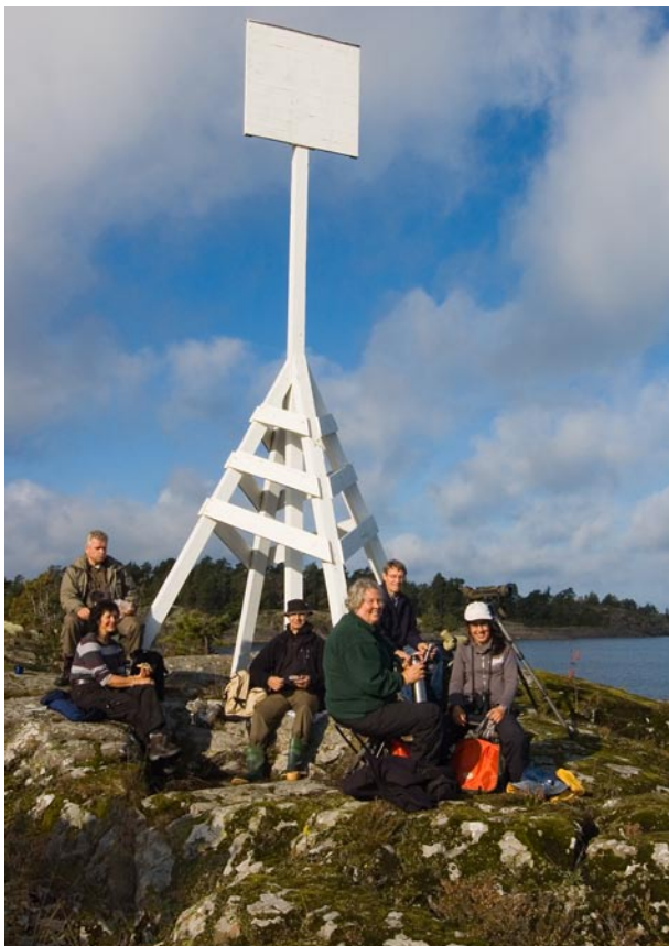
Stor Eken